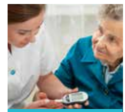
Prise en charge psychologique