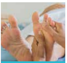
Pédicure (essentiellement pour les diabétiques)